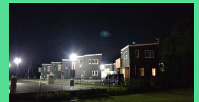
台風被害で停電したが、 迅速に復旧した千葉県睦沢市