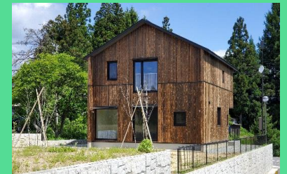
山形県の高断熱省エネ住宅