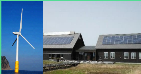
洋上風力発電と太陽後発電