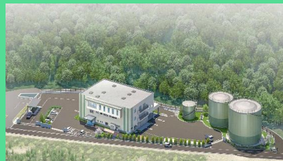
真庭市の生ごみ等資源化施設