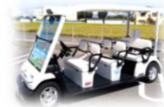
電動で時速20km未満で公道を走る4人乗り以上のモビリティ