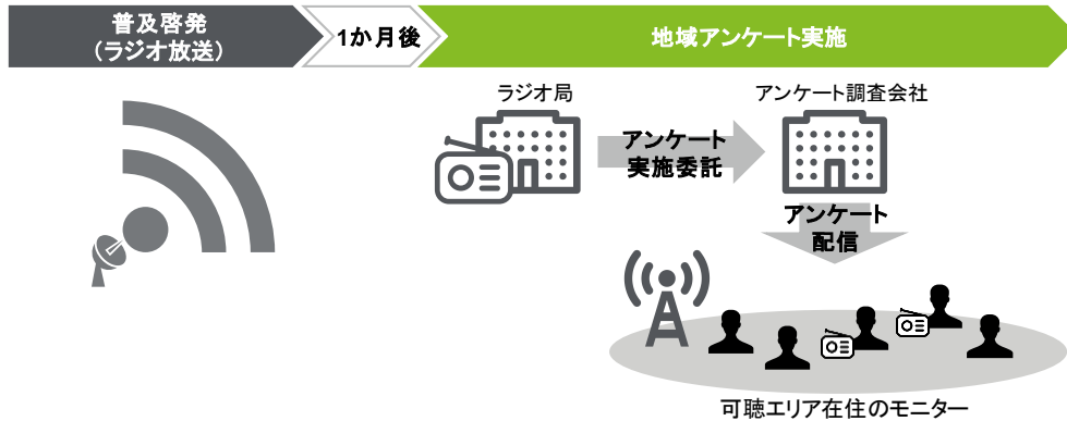
図 1 情報発信型(受動型)事業/ラジオにおけるアンケート実施概要

情報発信型(受動型)事業のラジオでは、アンケート調査会社に委託し、ラジオ放送 1 か月後に放送エリア(可聴エリア)在住のリスナーに対してアンケート(地域アンケート)を行う(図 1)。